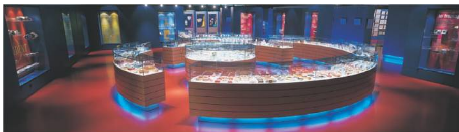
La Cité du Lait, le plus grand musée laitier et fromager du monde. www.lactopole.com/fr/

* Remarque : Pour des raisons d'organisation, l'activité ludique choisie doit être la même pour l'ensemble de l'équipe.