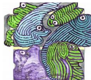
Musée d'art Naïf de Laval La plus belle collection d'Art naïf d'Europe