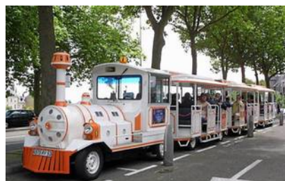
Le petit train de Laval

Les 3 pages « fiche d'inscription » sont à remplir et à retourner avec le paiement de l'inscription à l'adresse suivante :