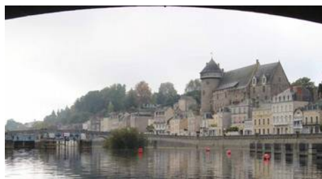
Visite du vieux Laval